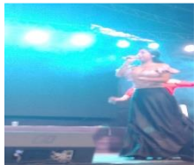
Fortalecimiento de la cultura y música local