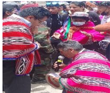
Desfile cultura y tradicional