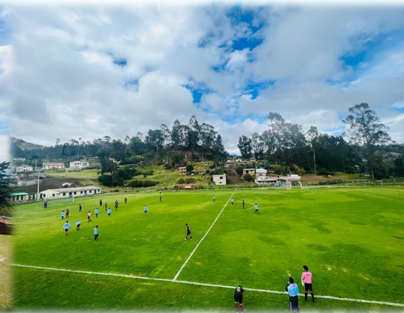
ESTADIO PUCARA QUINCHE